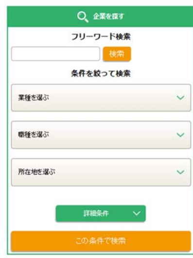
スマートフォン用画面

昨今の売り手市場の採用状況で、ネームバリューのある大手企業に学生が集まるなか、採用意欲のある投資先中小企業からのニーズに応じて開設しました。